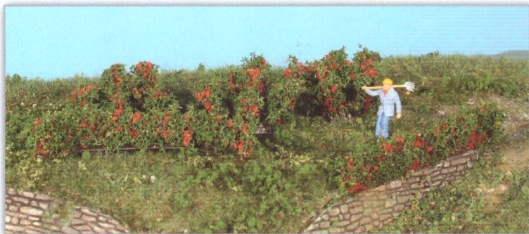
19125 10 Rosenhecken und Büsche 0,7 - 3 cm rose hedges and bushes / haies et buissons de roses

Die neuen Rosenhecken und Büsche bereichern Ihren Garten und sind ein farblisches Highlight auf jeder Modellbahnanlage.