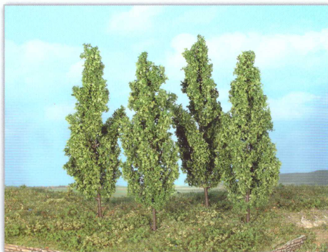
19110 4 Pappeln 13 cm poplar trees / peupliers