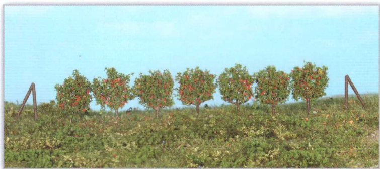
19135 Spalierobst, 36 Stück, ca. 2,5 cm incl. Spannposten espalier trees / arbres fruitier en espalier

Spalierobst wird gerne an Hauswänden oder Mauern gepflanzt oder aber freistehend im heimischen Garten.