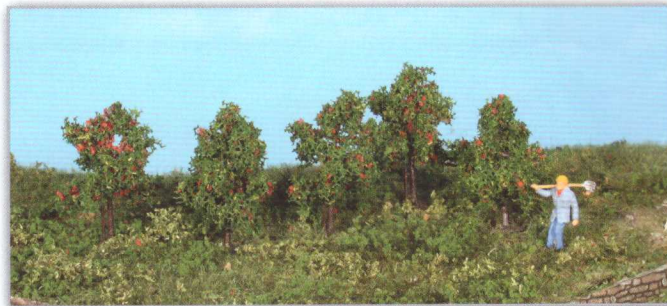
19131 5 Apfelbäume 4 cm apple trees / pommiers