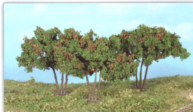
19112 3 Maulbeerbäume 7 cm mulberries / mûriers