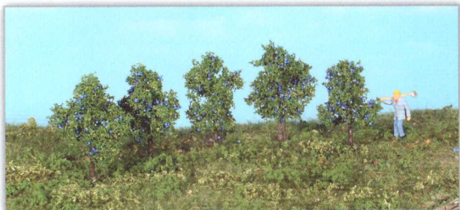
19132 5 Zwetschgenbäume 4 cm plum trees / pruniers