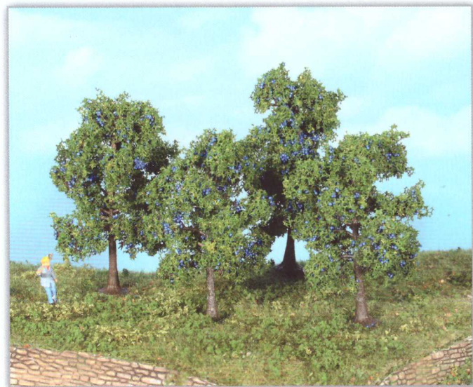
19114 4 Zwetschgenbäume 6 + 9 cm plum trees / pruniers