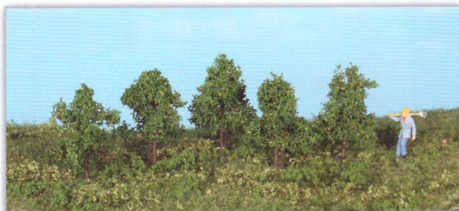
19130 5 Laubbäume 4 cm leafy trees / arbres à feuilles

The new super artline trees can be used for all track gauges from H0 to Z. For H0 as young-trees or as normal trees for for the other track gauges.