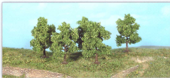
19111 5 Obstbäume 7 cm fruit trees / arbres fruitiers

We expand our realistic model tree-series by 4 wonderful models. The super realistic flocking material give these trees their unique natural appearance.