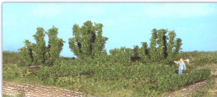
19126 8 Büsche und Hecken 0,7 - 5 cm bushes and hedges / buissons et haies