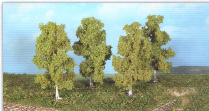
19120 4 Birken 11 cm birch trees / bouleaux