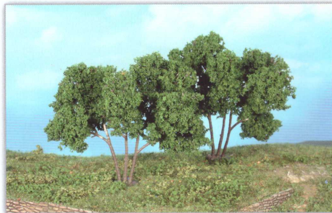
19113 2 Hainbuchen 9 cm hornbeams / charme