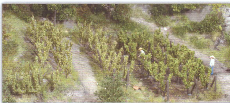
19136 36 Rebstöcke ca. 2,5 cm incl. Spannposten grape vines / vignes